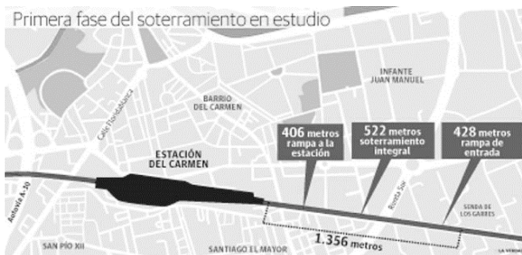
Figura 4. Plano de la modificación a lo previsto en el PITVI tras las protestas iniciadas en 2012. Incluye soterramiento parcial

impacto económico positivo en Murcia. Sin embargo, se han constatado dos hechos que han sembrado dudas en la Plataforma sobre las intenciones de traer el AVE a Murcia por Alicante, y no por Albacete, la vía natural de la línea, aunado a las prisas: el supuesto fraude relacionado con las obras —que ahora mismo está siendo investigado por la justicia (Aguirre)— y la privatización de la línea Madrid-Murcia anunciada por el Ministerio de Fomento en 2014 (De la Peña).