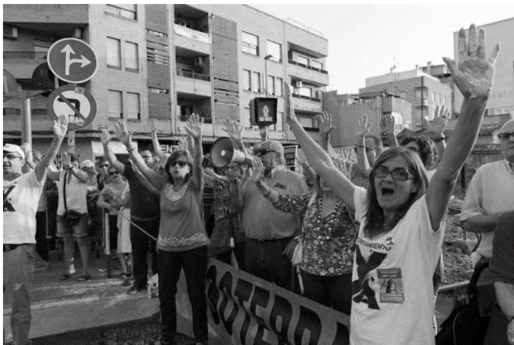
Figura 1. Concentración en las vías